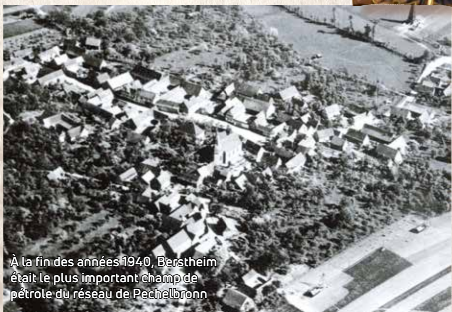
À la fin des années 1940, Berstheim était le plus important champ de pétrole du réseau de Pechelbronn

L'église de Berstheim est dédiée à Saint-Martin. L'importance historique de St Martin de Tours tient surtout au fait qu'il a créé les premiers monastères en Gaule : Saint-Martin laisse dans notre Église son empreinte spirituelle. Le début des travaux de construction de l'église dateraient de 1742, pour se terminer en 1769. L'édifice a bénéficié de nombreuses restaurations et rénovations, dont les plus importantes sont citées dans cette brochure.